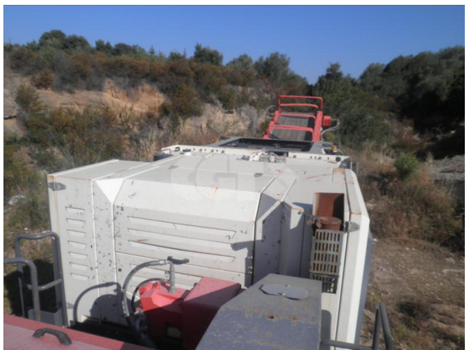
FRANTOI - SANDVIK - QJ341 27/02/2020 - VERGABORIS