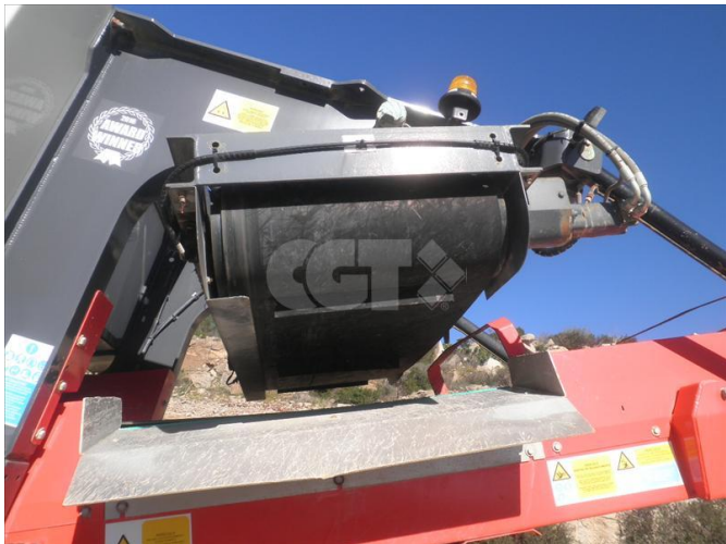
FRANTOI - SANDVIK - QJ341 27/02/2020 - VERGABORIS