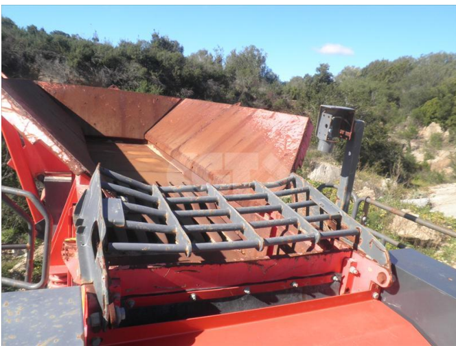
FRANTOI - SANDVIK - QJ341 27/02/2020 - VERGABORIS