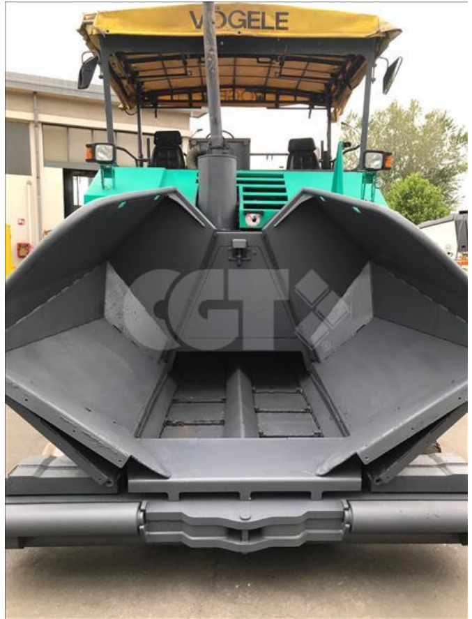
VIBROFINITRICE GOMMATA - VÖGELE - 1803 24/05/2020 - VN000001