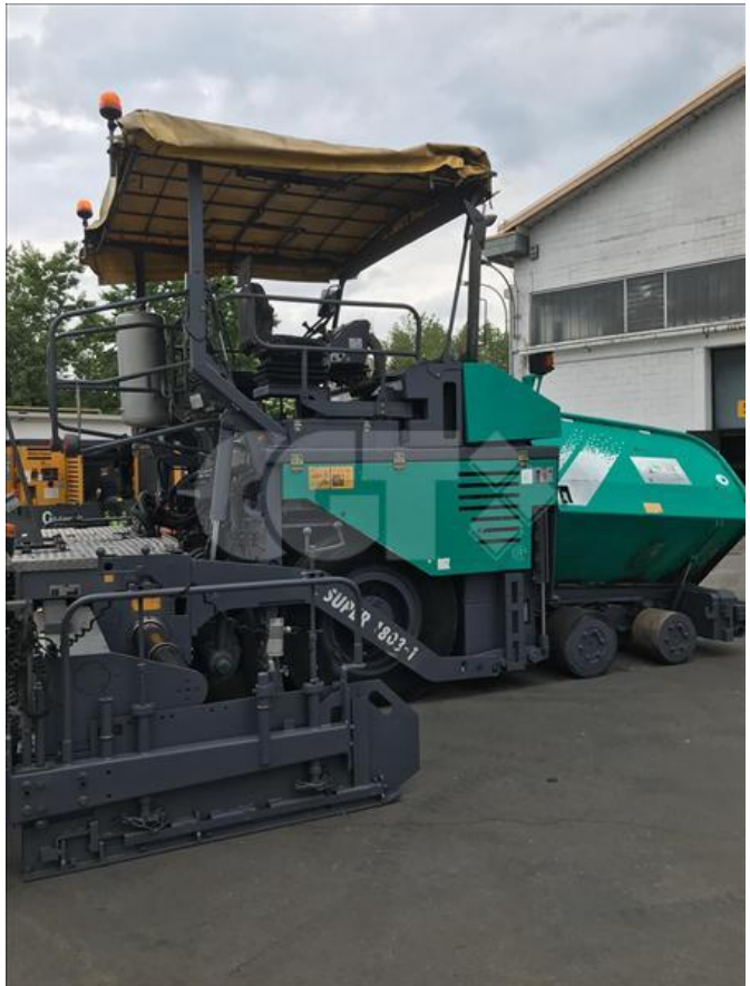
VIBROFINITRICE GOMMATA - VÖGELE - 1803 24/05/2020 - VN000001