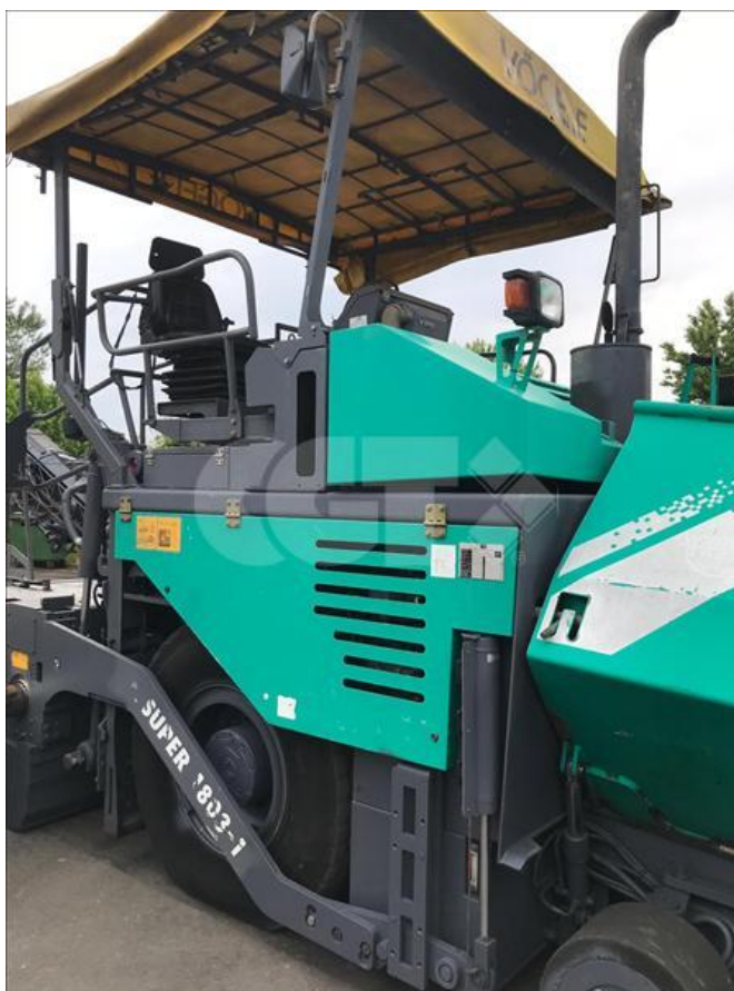
VIBROFINITRICE GOMMATA - VÖGELE - 1803 24/05/2020 - VN000001