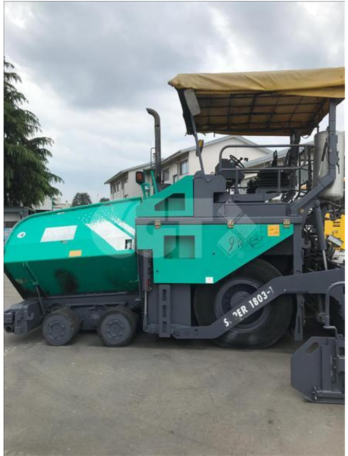
VIBROFINITRICE GOMMATA - VÖGELE - 1803 24/05/2020 - VN000001