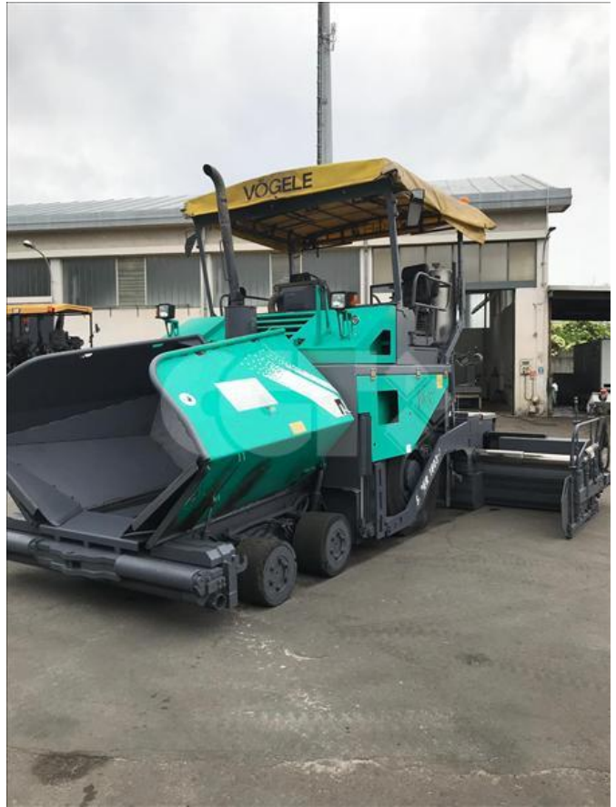
VIBROFINITRICE GOMMATA - VÖGELE - 1803 24/05/2020 - VN000001