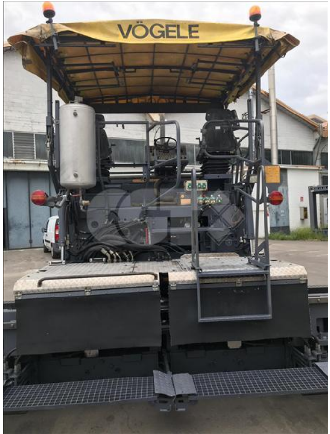
VIBROFINITRICE GOMMATA - VÖGELE - 1803 24/05/2020 - VN000001