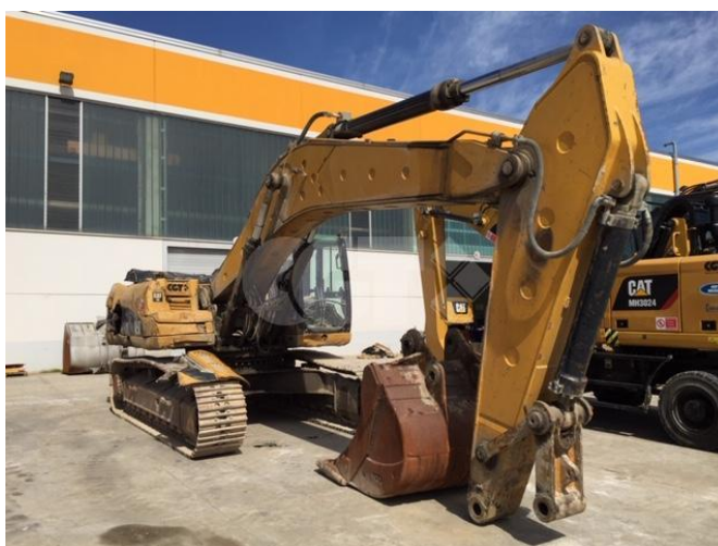
ESCAVATORE CINGOLATO MEDIO - CATERPILLAR - 330D LN 11/06/2020 - V0901632