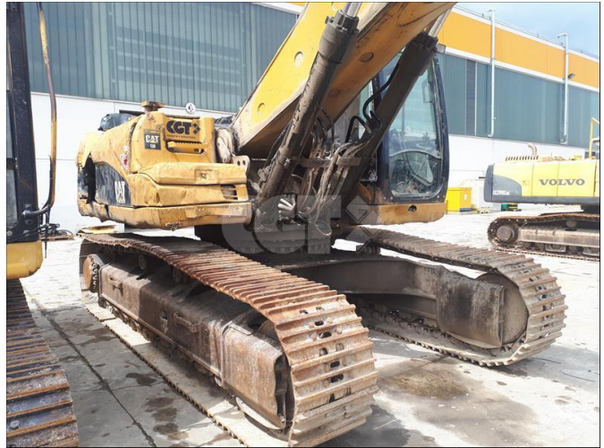
ESCAVATORE CINGOLATO MEDIO - CATERPILLAR - 330D LN 11/06/2020 - V0901632