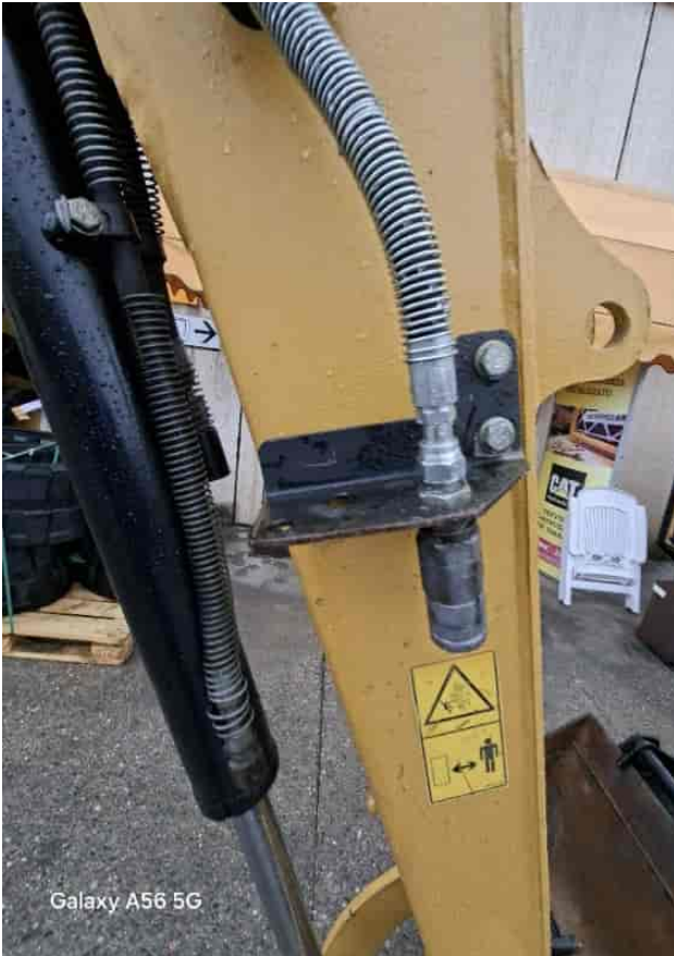
Galaxy A56 5G