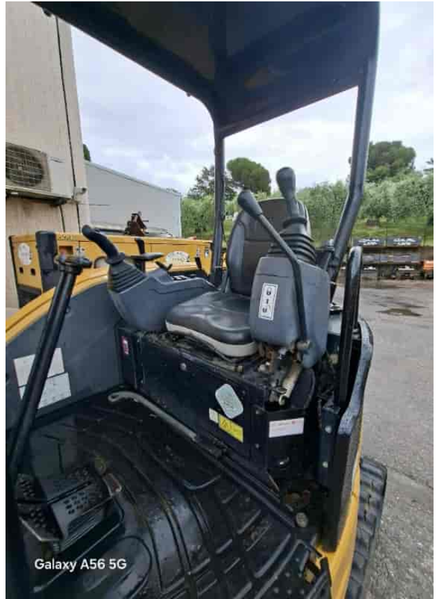
Galaxy A56 5G